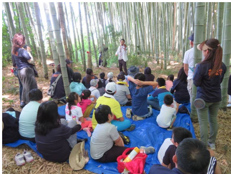
竹林でのバイオリン演奏会